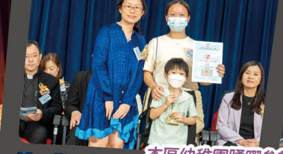
本區幼稚園踴躍參加校慶活動