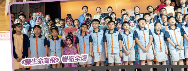
《願生命高飛》響徹全場