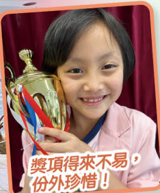
獎項得來不易，份外珍惜！