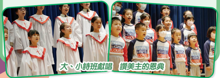
大、小詩班獻唱 讚美主的恩典

本年度的復活節崇拜在3月31日舉行，分為低年級(一至三年級)及高年級(四至五年級)兩節崇拜。是次是疫情以來首個實體復活節崇拜，由傳道人分享主耶穌為世人的罪捨身，在十架上流出寶血，洗淨我們的罪。