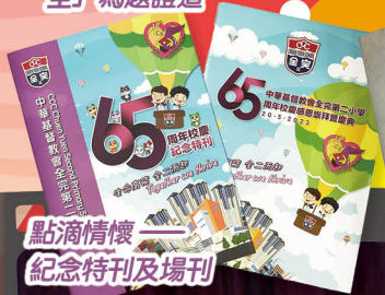
點滴情懷 紀念特刊及場刊