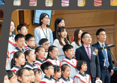
師生聯合詩班獻詩