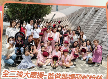
全三強大應援-爸爸媽媽頭號粉絲