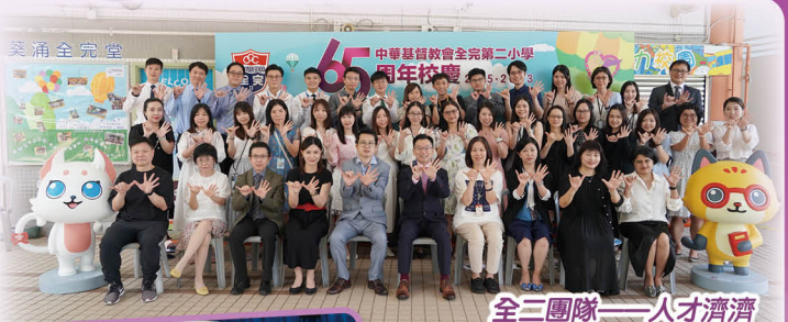
全二團隊——人才濟濟

聚才 「全二是一個聚才——匯聚人才的地方！」這句評語是某位資深的校長在經歷校慶慶典及感恩晚宴一整天的活動後給我們的贈言。當天，類似的評價不絕於耳。作為全二的一員，我十分自豪，因為全二的教職員確是優質的。他們日復日勤懇工作，令「純樸自律，愛主愛人」的精神沒有因歲月的流逝而擦淡；同時與時並進，發揮創意，為學校及學生創造奇蹟，使學校愈老愈有活力。校慶慶典當天，意念嶄新的佈置、一絲不苟的款待、原創的校慶主題歌、電子樂團的序樂、無人機慶賀的環節、別開生面的粵劇演繹、含互動元素的中樂表演，都跳出了固有的框框，帶人進入了新時代。這一切全是本校同工發揮潛能所使然。這些人才孕育出另一批人才——我們的學生，讓他們在校園中嶄露頭角，建立自信，發揮所長。