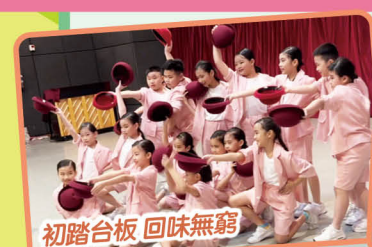
初踏台板 回味無窮