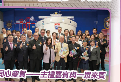
同心慶賀——主禮嘉賓與一眾來賓