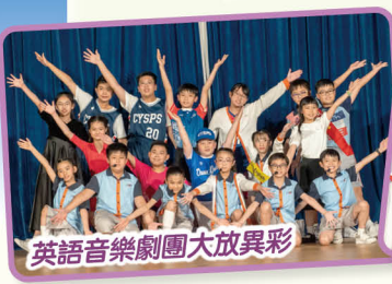
英語音樂劇團大放異彩

回想，對於大部分校友而言，今天的校舍外觀和內裏的人事物已面目全非，但他們仍關顧母校及學弟學妹的需要，相信是源自一種「不能言喻」的感情。盼未來校友——今天的同學，傳承這份「不能言喻」的感情，讓全二在你心中永遠佔據一席位。