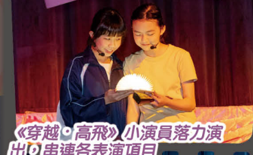
《穿越·高飛》小演員落力演出，串連各表演項目