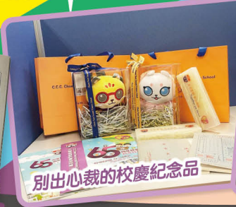
別出心裁的校慶紀念品