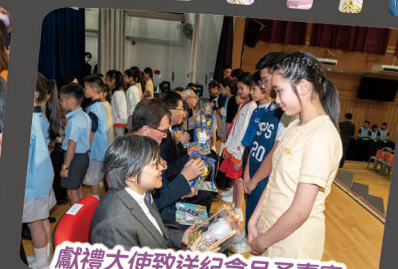
獻禮大使致送紀念品予嘉賓