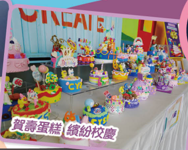
賀壽蛋糕 繽紛校慶