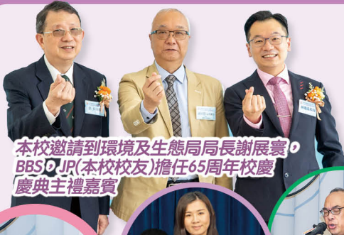
本校邀請到環境及生態局局長謝展寰、BBS DJR(本校校友)擔任65周年校慶慶典主禮嘉賓

本校自1958年創校以來，今年適逢65周年誌慶，學校於本學年籌辦各項慶祝活動。5月20日學校舉辦65周年校慶感恩崇拜及慶典，為一系列慶祝活動推至高峰，典禮上除了盡展全二精彩一面外，大合唱《生命高飛》亦展現溫情一面。