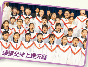
頌讚父神上達天庭