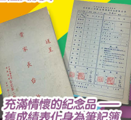
充滿情懷的紀念品 舊成績表化身為筆記簿