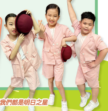
我們都是明日之星